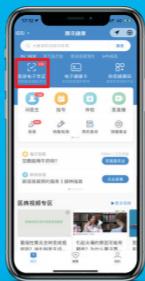
5、点击上方“国家医保电子凭证”