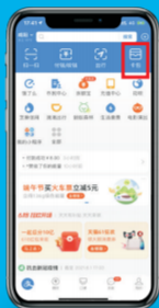
2、点击页面右上角卡包