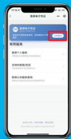
6、进入界面进行激活