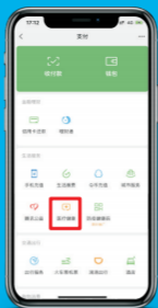
4、点击生活服务中的“医疗健康”